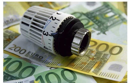
Richtiges heizen kann bares Geld sparen

Auch Berufstätige können dafür Sorge tragen, morgens, abends und an Wochenenden ausreichend, entsprechend den vorgenannten Orientierungen zu lüften. So kann während der Abwesenheit kein Feuchtebestand entstehen.